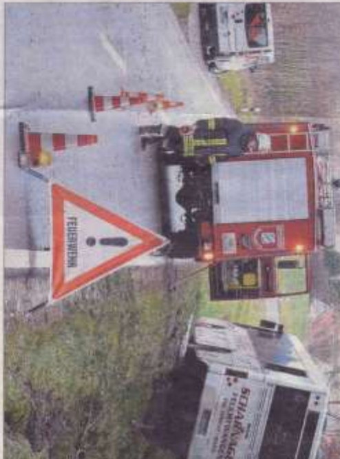
Diese Bild bot sich am 5. Dezember im Raum Herrrieden auf der Straße nach Schönau. Sieben nicht angeschnallte Kinder konnten verletzt, ein Bus von der Straße abkom.

Wie die Polizei mitteilte, galt für die Kinder keine Anschnallpflicht. Dem er habe sich um einen Lenkungsgehandelt. In dem auch Stehplätze ausgegliedert seien. Diese Stehplätze auch für Schüler nahm der Wieseths Kirchenvereinsvorstand in seinem Brief an Schweinbauer ins Visier. In dem an die Unterschreibenden angehängten Schreiben heißt es: „Es ist nicht auszudenken, was passiert wäre, wenn der Bus überfällig gewesen wäre.“ Der Kirchenvorstand stößt die Frage, sagt der Pfarrer zur FLZ, ob man die Vorschriften für die Fahrt zur Schule, „so verändern kann, dass jedes Kind einen Platz hat und angeschnallt ist.“